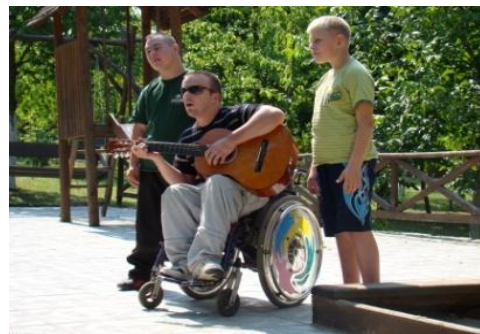
Ужгород, Закарпатська область