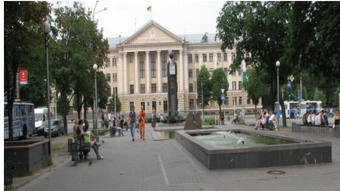
Міська рада м. Запоріжжя

Агенція вже уклала договори з облдержадміністрацією та з Регіональним фондом підтримки підприємництва в Запорізькій області на проведення конкурсу на кращий проект, розроблений за стратегічними пріоритетами області, який в 2010 році отримає фінансування з держбюджету.