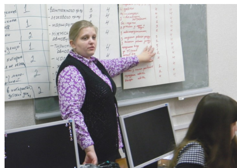
Учасники і учасниці ПНТ проводять аналіз зацікавлених сторін своїх проектів та стратегій

Під час навчання в рамках програми ПНТ за допомогою методів гендерного аналізу учасники і учасниці мали визначити проблемні питання з погляду гендерної та соціальної рівності, які виникають під час розробки місцевих стратегій. Зокрема — відсутність даних за ознакою статі, в цілому, а також відсутність регіональних даних щодо випадків недотримання принципів гендерної рівності. Учасники вирішували ці проблеми за допомогою пошуку даних у національних джерелах, отримання інформації з непрямих джерел та отримання даних від відповідних проектів та ініціатив. Заняття з оцінки гендерного та соціального впливів допомогли учасникам і учасницям у пошуку даних для проведення гендерного аналізу та у визначенні того, яким чином в процесі РЕР мають враховуватися потреби жінок та чоловіків, а також молоді, людей з особливими потребами, людей похилого віку та