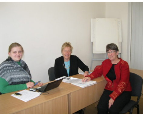
Провідні експертки проекту РВР з гендерних та соціальних питань (Україна і Канада)

Однією з важливих наскрізних цілей ПНТ було досягти розуміння учасниками та учасницями програми шляхів впливу розроблюваних проектів на жінок, чоловіків та молоді у їхніх громадах. Три українські гендерні експертки за підтримки канадських експертток з питань гендерної рівності та розвитку громадянського суспільства готували та навчали учасників та учасниць ПНТ та надавали консультації з питань методів найкращого врахування потреб жінок та чоловіків та забезпечення їхньої участі у розробці проектів.