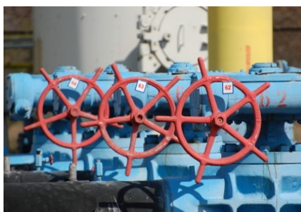
Вдосконалення інфраструктурних проєктів за допомогою гендерного аналізу

Увага, яка приділялася гендерним та соціальним питанням в рамках ПНТ, дозволила учасникам отримати багато інформації щодо кращих практик та прикладів застосування методів оцінки